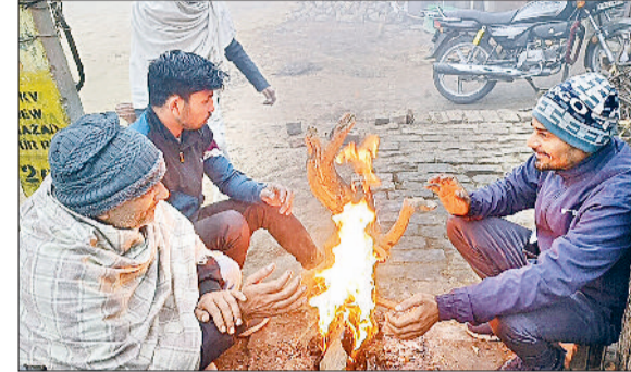
सोनीपत। हाड कंपा देने वाली ठंड में अलाव का सहारा लेते लोग।

खूब अहसास करवाया। शीतलहर ने एक ओर तो लोगों को खूब कंपकंपाया, वहीं शीतलहर की वजह से जिले के प्रदूषण में कमी दर्ज की गई। वायु गुणवत्ता सूचकांक में काफी कमी दर्ज की गई है। वायु गुणवत्ता सूचकांक 162 दर्ज किया गया। एक दिन पहले यह 249 दर्ज किया था। दूसरी ओर शीतलहर के चलते कोहरा ज्यादा देर तक टिक नहीं पाया। सुबह 11 बजे तक कोहरा सड़कों से गायब हो गया था। मौसम विशेषज्ञों की मानें तो आने वाले दिनों में शीतलहर और कोहरा इसी तरह से परेशान करेगा। जिले में सोमवार को यूं तो 11 बजे के करीब ही सूर्य देव के दर्शन हो गए थे। धूप भी पूरा दिन अच्छी खासी रही। इसके बावजूद जिले में लोगों को ठंड ने खूब परेशान किया। जिसकी सीधी वजह शीतलहर रही। जिले में सोमवार को 5 किलोमीटर प्रतिघंटा