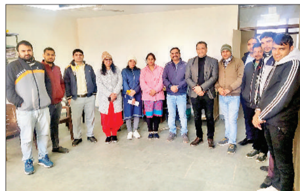
सोनीपत। कर्मचारियों को महारैली का निमंत्रण देने पहुंचे समिति के पदाधिकारी।