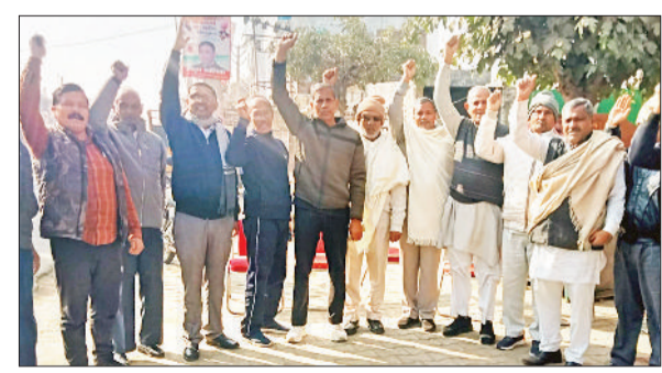
गोहाना। संत रामभद्राचार्य के खिलाफ प्रदर्शन करते महासभा के सदस्य।