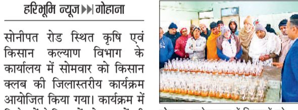
गोहाणा। प्रयोगशाला में किसानों को नमूनों के विश्लेषण की जानकारी देते हुए विशेषज्ञ।