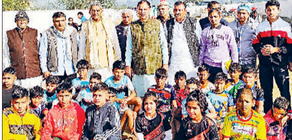
गोहाणा। विजेता एवं उप विजेता टीमों को सम्मानित करते हुए अतिथि।