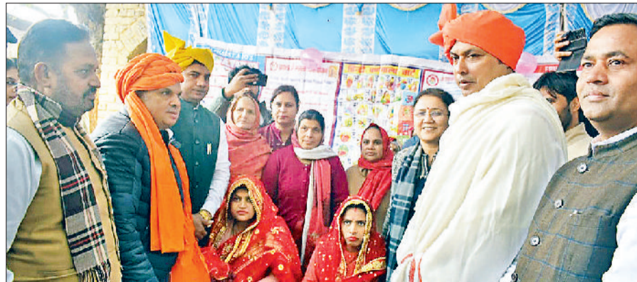
गन्नीर। यात्रा के दौरान गोद भराई की रस्म में महिलाओं को फल देते हुए भाजपा के हरियाणा प्रभारी एवं राज्यसभा सांसद बिल्लब देव, सांसद व विधायक।

हरिभूमि न्यूज़ गन्नीर त्रिपुरा के पूर्व मुख्यमंत्री एवं भाजपा के हरियाणा प्रभारी एवं राज्यसभा सांसद बिल्लब देव ने टेहा गांव में विकसित भारत संकल्प यात्रा के दौरान गांव का रिपोर्ट कार्ड प्रस्तुत करते हुए वर्तमान सरकार में हुए गांव के विकास की जानकारी दी। साथ ही उन्होंने कहा कि विपक्षी दलों के नेता जो खुद विधायक भी नहीं वे रोज डिप्टी सीएम बनाने की घोषणाएं कर रहे हैं। पूर्व मुख्यमंत्री बिल्लब देव सोमवार को टेहा में आयोजित विकसित भारत संकल्प यात्रा जनसंवाद कार्यक्रम में उपस्थित जनसंघ को मुख्यातिथि के रूप में संबोधित कर रहे थे। उन्होंने कहा कि दस-दस डिप्टी सीएम बनाने की घोषणा करने वाले दलों को जनता नकार चुकी है, क्योंकि बच्चों को भी उन पर विश्वास नहीं होता। हम अपनी संस्कृति में विश्वास करते हैं जबकि कांग्रेस के संस्कार विदेशी हैं। पूर्व मुख्यमंत्री बिल्लब देव ने कहा कि भारत विकसित है। इसका उदाहरण जी-20 सम्मेलन रहा जिसमें अमरीका के प्रेजिडेंट ने भी भाषिणा किया। जब नरेंद्र मोदी मुख्यमंत्री थे तो अमरीका ने उनको वीजा देने से इंकार कर दिया और आज ऐसा समय है कि अमरीकी प्रेजिडेंट मोदी जी को दूढ़ते