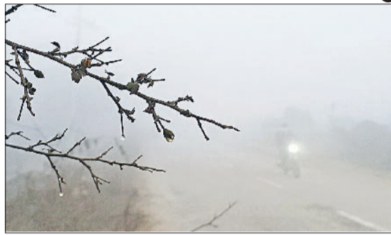
सोनीपत। ग्रामीण क्षेत्रों में जमा पाला।

खूब अहसास करवाया। शीतलहर ने एक ओर तो लोगों को खूब कंपकंपाया, वहीं शीतलहर की वजह से जिले के प्रदूषण में कमी दर्ज की गई। वायु गुणवत्ता सूचकांक में काफी कमी दर्ज की गई है। वायु गुणवत्ता सूचकांक 162 दर्ज किया गया। एक दिन पहले यह 249 दर्ज किया था। दूसरी ओर शीतलहर के चलते कोहरा ज्यादा देर तक टिक नहीं पाया। सुबह 11 बजे तक कोहरा सड़कों से गायब हो गया था। मौसम विशेषज्ञों की मानें तो आने वाले दिनों में शीतलहर और कोहरा इसी तरह से परेशान करेगा। जिले में सोमवार को यूं तो 11 बजे के करीब ही सूर्य देव के दर्शन हो गए थे। धूप भी पूरा दिन अच्छी खासी रही। इसके बावजूद जिले में लोगों को ठंड ने खूब परेशान किया। जिसकी सीधी वजह शीतलहर रही। जिले में सोमवार को 5 किलोमीटर प्रतिघंटा