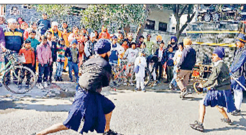
सोनीपत। नगर कीर्तन में करतब दिखाते गत पार्टी के सदस्य।

गुरुद्वारा श्री गुरु सिंह सभा सुजान सिंह पार्क से गुरु गोविंद सिंह के प्रकाश पर्व की खुशी में नगर कीर्तन निकाला गया। गुरुद्वारा साहब से नगर कीर्तन आरंभ होकर मामा भांजा चौक, विवेकानंद चौक, गुरुद्वारा साहब सेक्टर 15, 14 सेक्टर, गुरुद्वारा गुरु नानक सत्संग सभा गीता भवन चौक, गुरुद्वारा कलगीधर सिंह सभा माडल टाउन होते हुए वापस गुरुद्वारा सुजान सिंह पार्क पहुंचकर नगर कीर्तन समाप्त हुआ। नगर कीर्तन में सिख मार्शल आर्ट में शामिल युवाओं