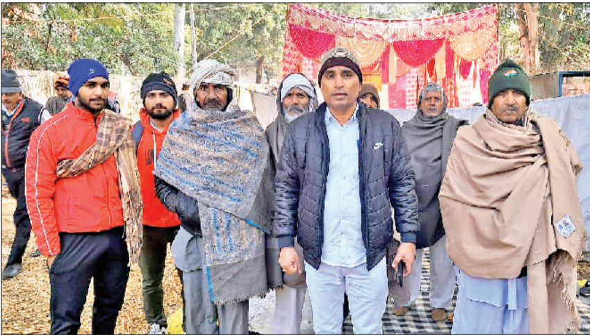
सोनीपत। लघु सचिवालय के सामने विरोध प्रदर्शन करते जुआं के ग्रामीण साथ में जिला पार्षद।